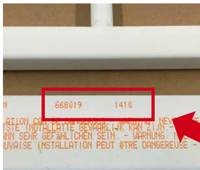
auf dem Gitter