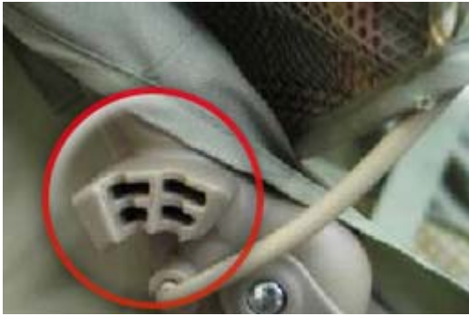
Abbildung-A Macht eine Sicherheitsabdeckung notwendig Abbildung-B Macht keine Sicherheitsabdeckung notwendig

Kinderwagen oder Reisesysteme mit dem in Abbildung „A“ gezeigten Scharnier SIND von diesem Sicherheitshinweis BETROFFEN. Kinderwagen, die mit einem in Abbildung „B“ gezeigten Scharnier ausgestattet sind, sind NICHT von diesem Sicherheitshinweis BETROFFEN.