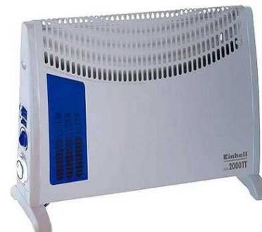
„KON 2000 TT“

Artikelnummer 23.386.50 und I.-Nr. 01014